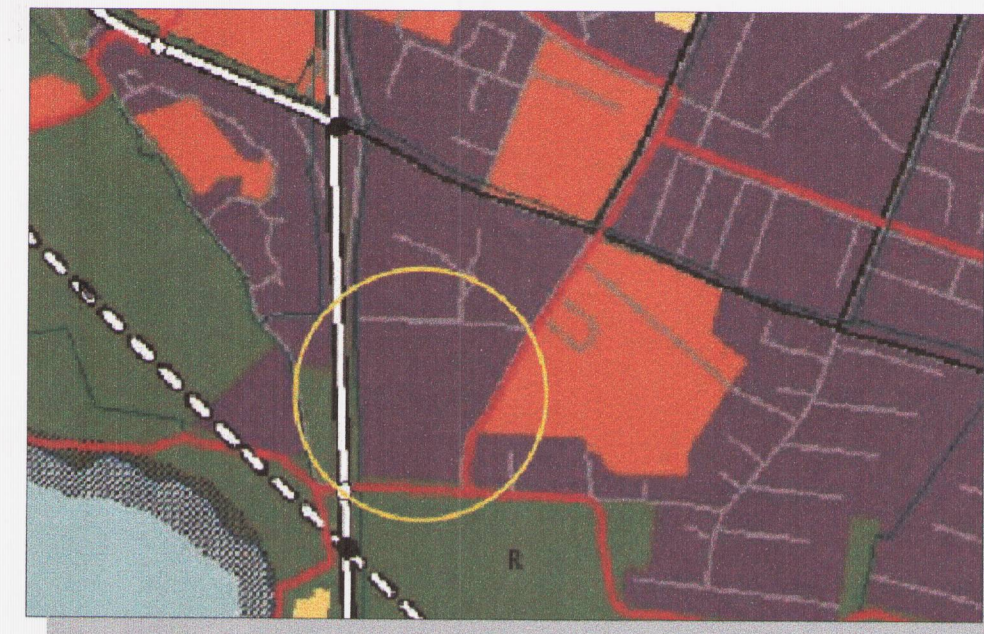
Gildandi aðalskipulag Reykjavíkur 2001-2024