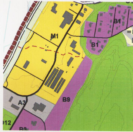
Staðfest aðalskipulag 21.12.2009 Mkv. 1:10.000