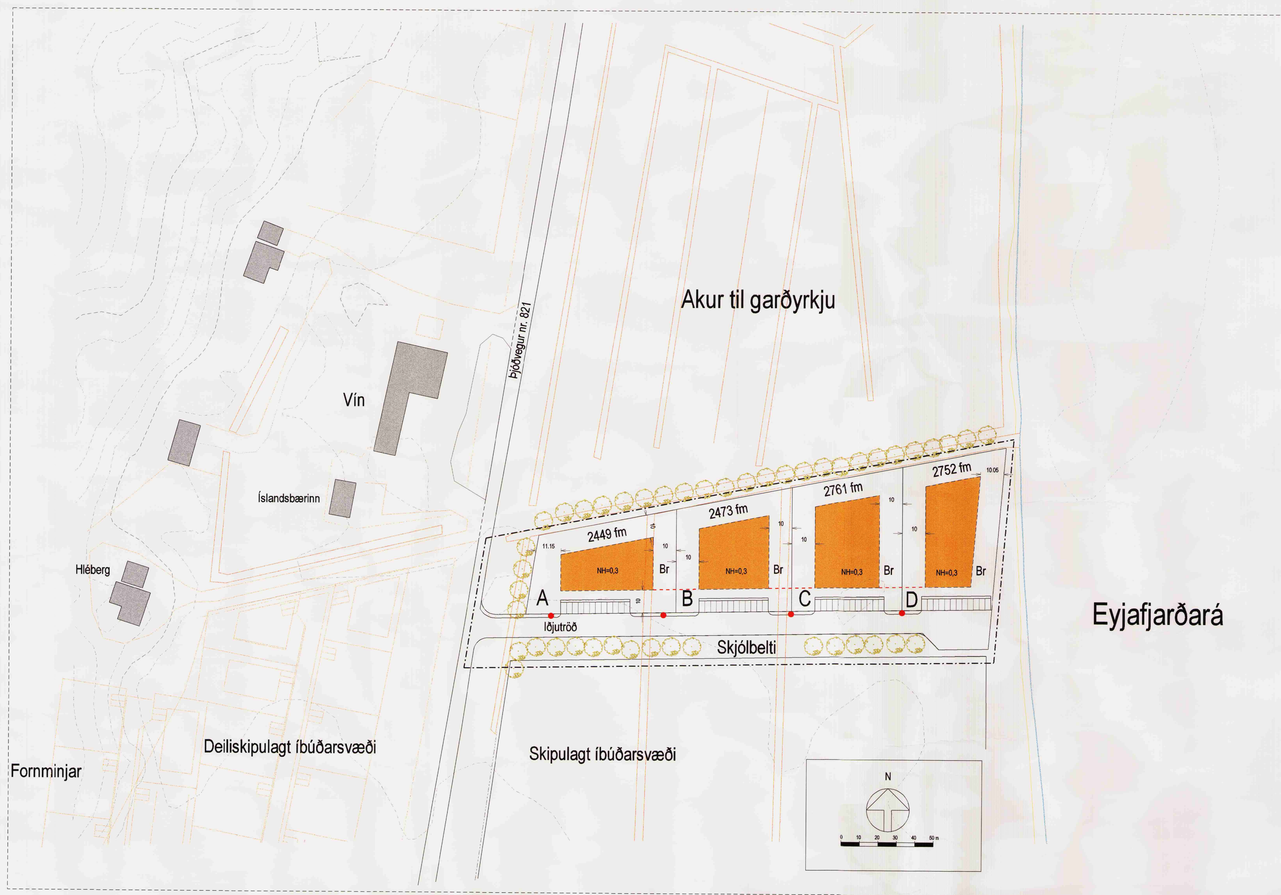
Deiliskipulag athafnasvæðis Mkv. 1/1000