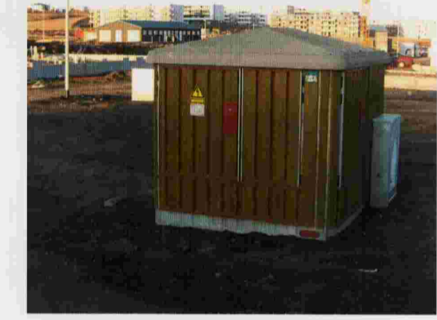
Skýringarmynd - smádreifistöð