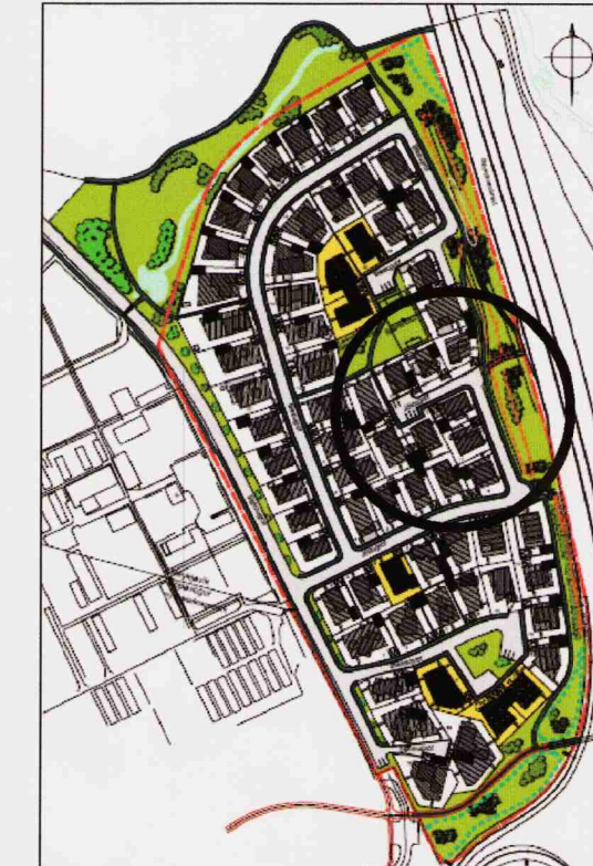
Hluti af Aðalskipulagi Reykjavíkur 2001-2024