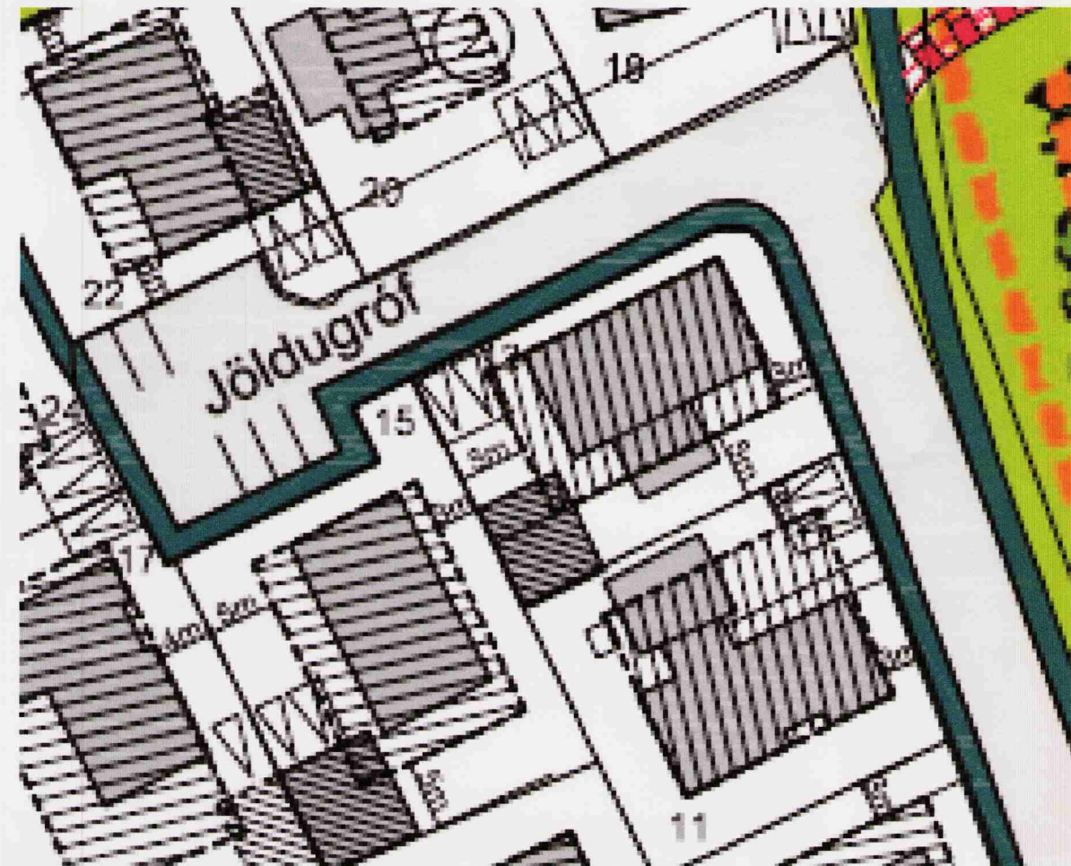
ÚRDRÁTTUR ÚR GILDANDI DEILISKIPULAGI eins og það var samþykkt í Skipulagsráði 28. september 2005