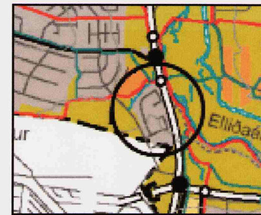
Hluti af Aðalskipulagi Reykjavíkur 2001-2024