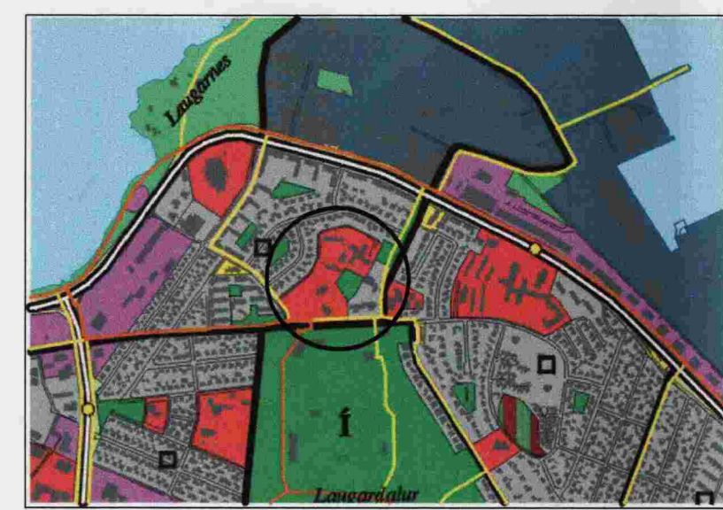
HLUTI ADALSKIPULAGS REYKJAVÍKUR 1996-2016