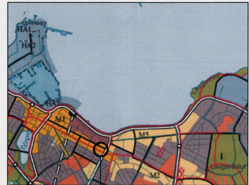
Staðgreinireitur 1.174.1 Hluti aðalskipulags Reykjavíkur 2001-2024