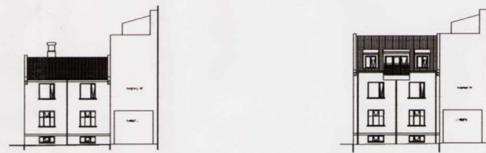
Hverfisgata 102B að vestan