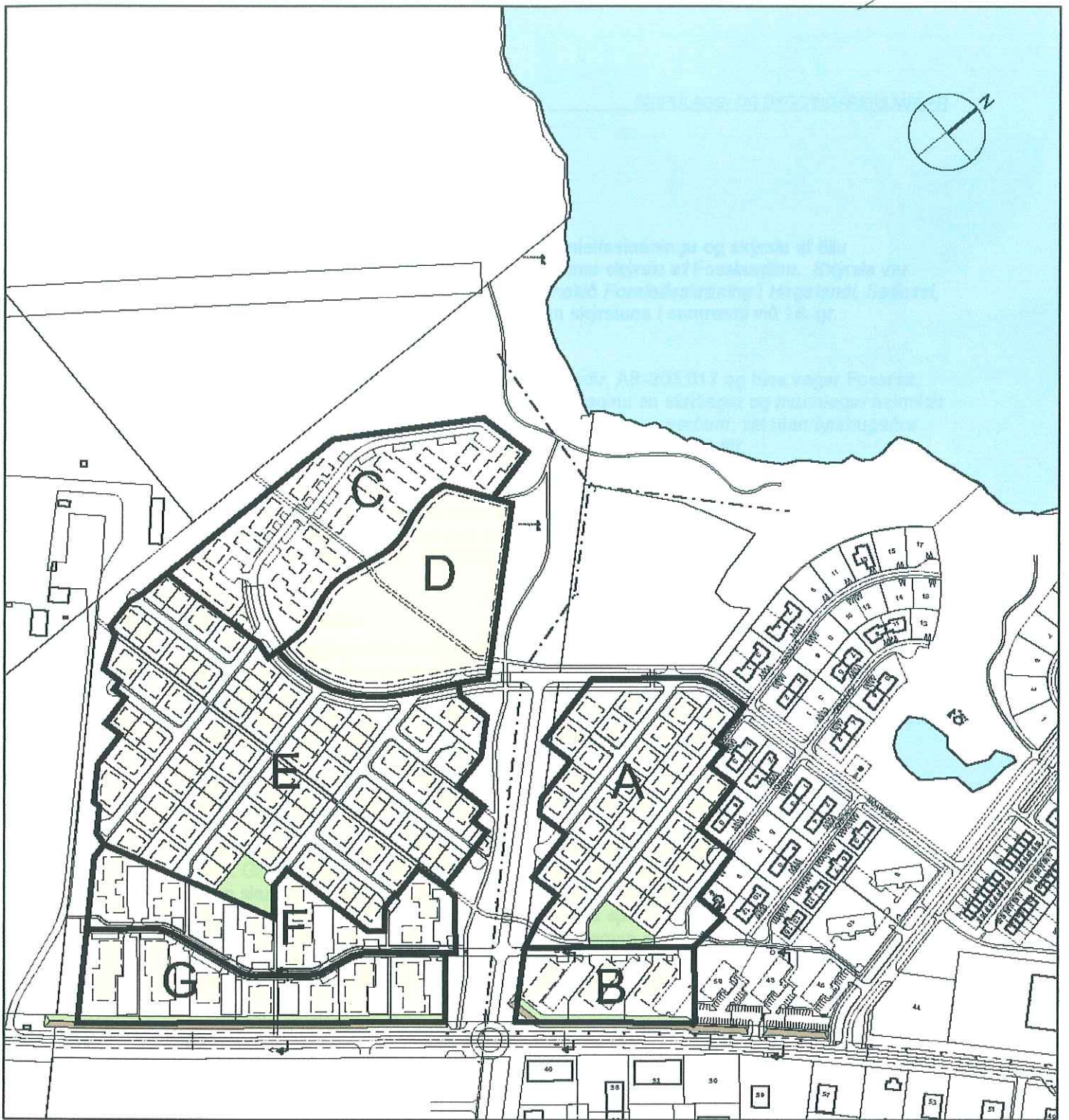
Skýringamynd - Reitskipting deiliskipulags