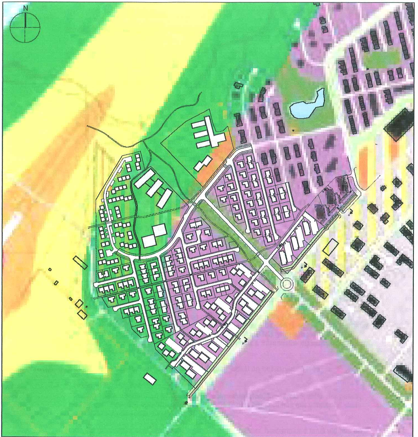
Skýringamynd vegna hljóðvistar flugvallar, ekki í kvarða