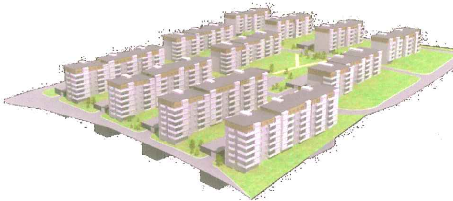
Yfirlitsmynd, horft til austurs