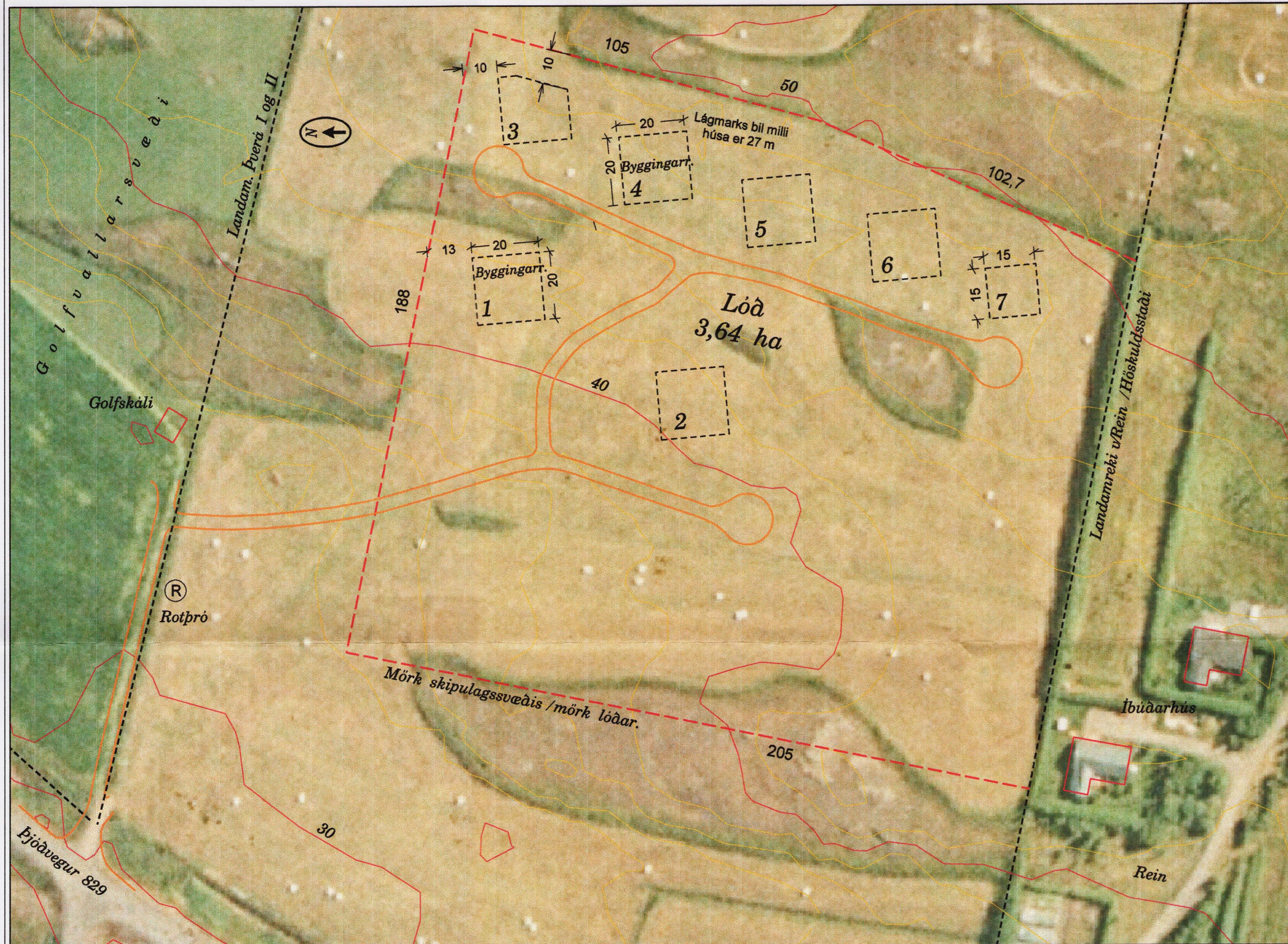
Deiliskipulag - mkv. 1:1000