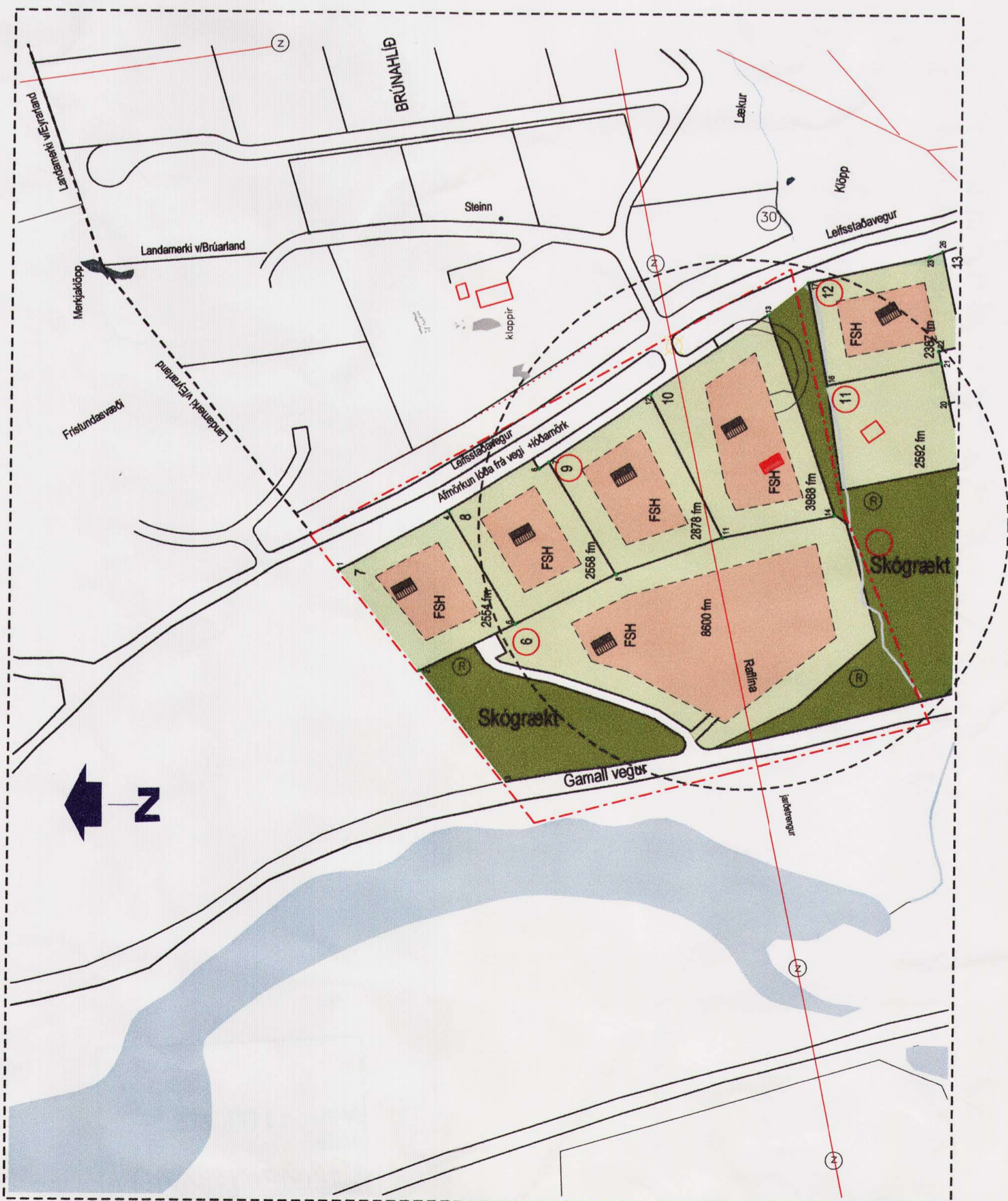
Aðalskipulag Eyjafjarðarsveitar 1994-2014