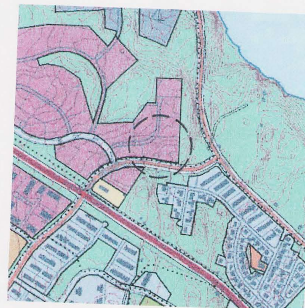
Aðalskipulag Akureyrar 1998-20018. Mkv. 1:10000

Deiliskipulag A-áfanga svæðis fyrir blandaða atvinnustarfsemi í Krossaneshaga var fyrst samþykkt í bæjarstjórn 2. febrúar 1993. Síðan þá hafa verið gerðar á því nokkrar stakar breytingar. Meðfylgjandi er tillaga að breytingu á lóð A1-b (nr. 4 við Freyjunes). Sótt er um að breyta byggingarreit eins og tillaga sýnir. Hæsti punktur byggingar frá neðri plötu er 9.2 metrar.