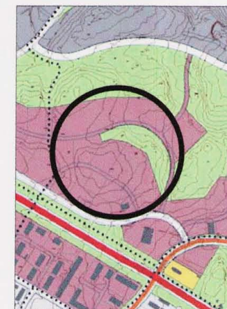
Aðalskipulag Akureyrar 1998-2018 Mælikvarði 1:10.000

Að öðru leyti gildi ákvæði skipulagsins óbreytt.