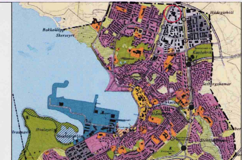
HLUTI GILDANDI ADALSKIPULAGS HAFNARFJARÐAR 2005-2025

Breytingin felst í því að gerður er byggingarættur fyrir viðbyggingu við ekkri verksmíðu að Reykjavík-urvegur 78. Viðbyggingin mun hýsa ýmsis tæknimannvirki endurnannaðrar verksmíðunnar. Hámarkshæð verði 8 metrar. Loftrásissamstæður og önnur tæknimannvirki meiga ná upp fyrir hámarkshæð. Heildar lóðarstærð verður óbreytt skv. mæliblaði, samtals 22.325,5 m². Nýtingarhlutfall verður 1.0. Komi til byggingu bílakjallara má hluti þeirra færrast niður í hann. Fjögga hatur verði um alla 5 bílastæði á lóðunum. Eftir skulu standa 230 stæði á lóðunum. Bílastæði í bílakjallara verði u.þ.b. 200 stk (110+90). Heildarfjöldi bílastæða á lóðunum (kjallari með talin) verði þá allt að 450 stk. Að öðru leyti gilda áður samþykktir skipulagsskilmálar. Bæjarsjórn Hafnarfjarðar lýsir því yfir, að sannanlegt sjón er einstakir aðilar kunna að verða fyrir við breytinguna, verður þetta.