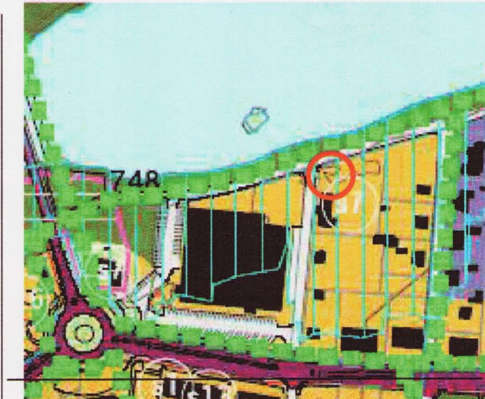
Údráttur úr aðalskipulagi Árborgar 2005-2025 (ekki í kvarða)

Deiliskipulagsbreytingartillaga þessi sem auglýst hefur verið skv. 1.mgr. 25.gr. skipulags- og byggingarlaga var samþykkt í skipulags- og byggingarnefnd þann 12/6 2008 og í bæjarstjórn þann 28/6 2008. Tillagan var auglýst frá 17/4 2008 til 29/5 2008.