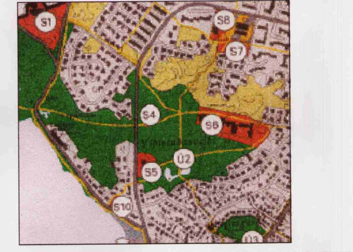
Áðalskipulag mkv 1:15000

Bílastæðið er að jafnaði mest vegna Viðistadakirkju, einkum þegar jarðarfari fara þar fram. Í kirkjunni eru sátt að hámarki fyrir 550 en dæmi eru um mun fleiri kirkjugestir við jarðarfari. Gert er ráð fyrir fjórum bílastæðum innan Hraunbrún og á nýju bílastæði sunnan og norðan þröðubúðisins. Ennfremur er gert ráð fyrir fjórum bílastæðum innan Hraunbrún. Loks er komið fram 20 "grasastæði" norðan kirkju fyrir starfsmenn kirkjunnar. Auk þess eru varabílastæði á lóðarmark Garðavelli og á lóðarmark Viðistadaskólans. Gert er ráð fyrir samræmdu bílastæði kirkju, skólans og þröðubúðis annars vegar og hins vegar bílastæði við Hraunbrún og leikskólann Hálla. Samtals verða bílastæði á lóðum og á bæjarlandi um 376.