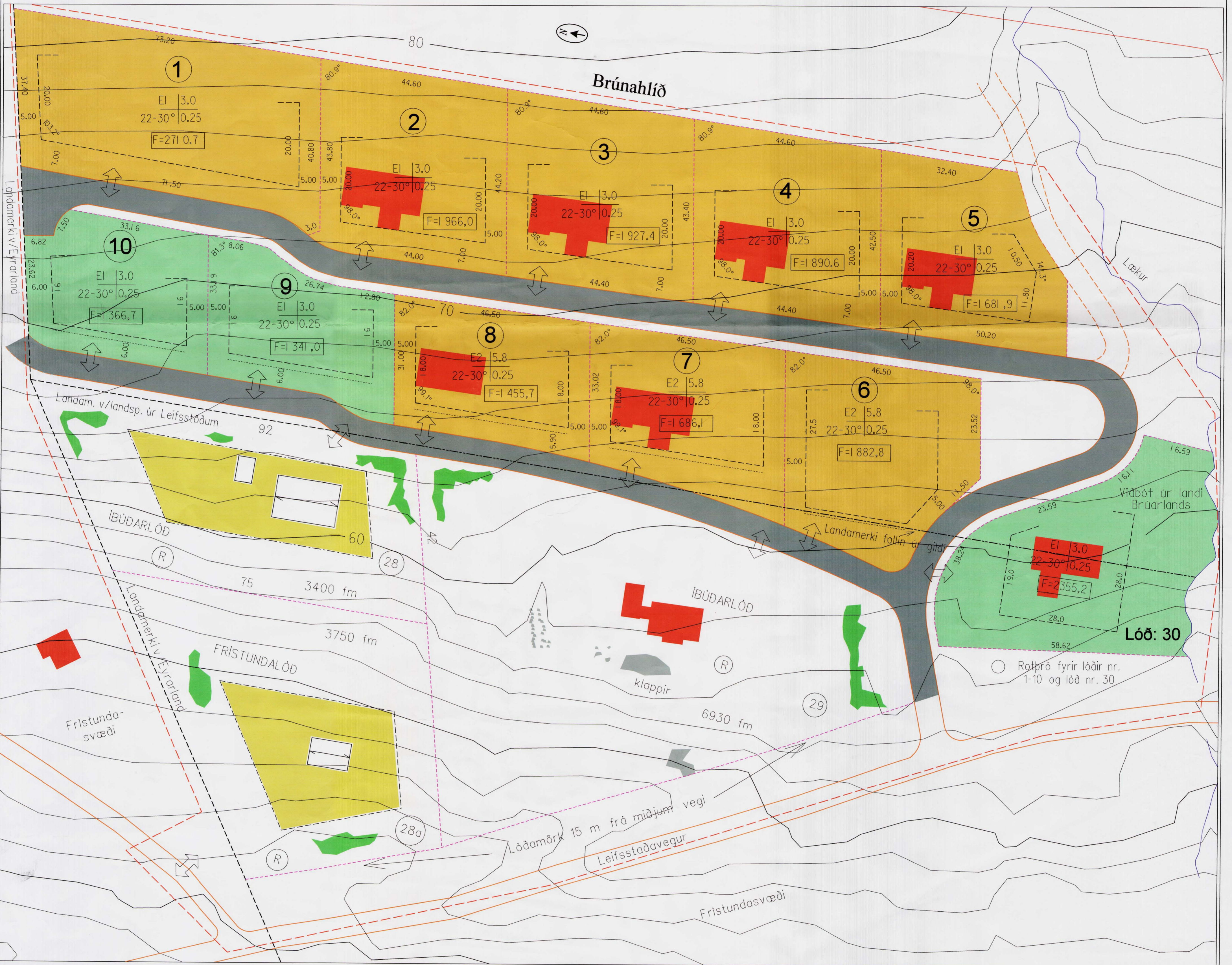
Deiliskipulag mkv. 1:500

Deiliskipulag þetta, sem hefur fengið meðferð skv. lögum nr. 73/1997