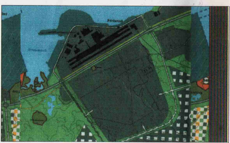
HLUTI AF AÐALSKIPULAGI HAFNARFJARÐAR 1995-2015