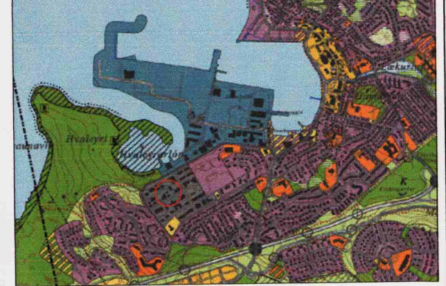
Hluti af Aðalskipulagi Hafnarfjarðar 2005-2025