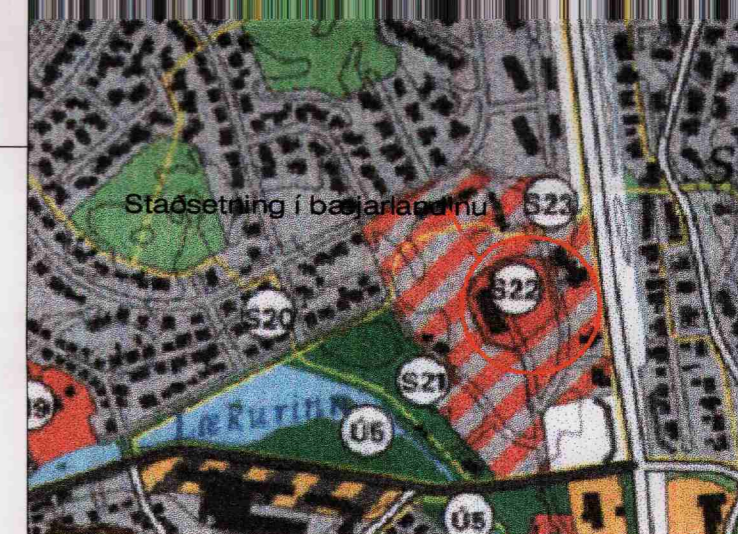
Staðsetning í bæjarlaginu

Bæjarstjórn Hafnarfjarðar lýsir því yfir að bætt verði sannanlegt tjón er einstaka aðilar verða fyrir við breytinguna.