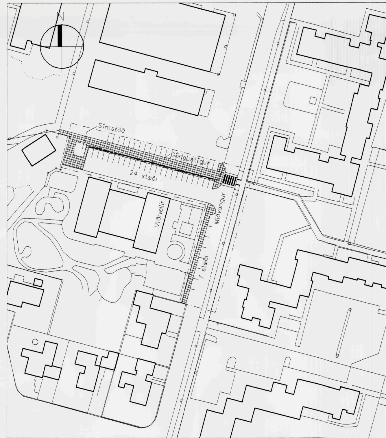
SKIPULAG EFTIR BREYTINGU 1:1000