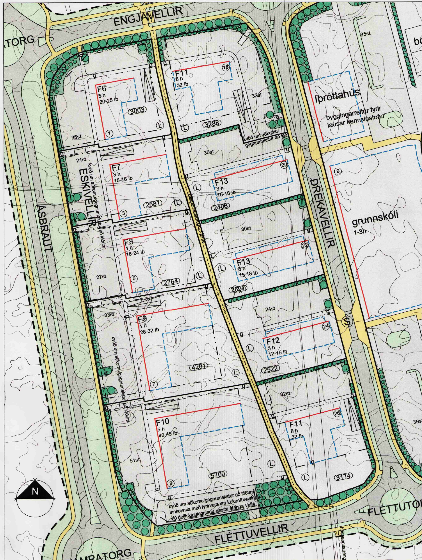
Tillaga að breyttu deiliskipulag mkv. 1:1000 = A2

5.2.8 Fjölbýlishús F8 Eitt fjögurra hæða vinkil laga fjölbýlishús F8 með bilgeymslu neðanjarðar, með staði fyrir a.m.k. 18 bíla er á skipulagssvæðinu. Öllum íbúðum stærrni en 80 m 2 skal fylgja a.m.k. eitt staði í bilgeymslu, sjá kafa 4.6. Íbúðafjöldinn er samtals 24 íbúðir. Í garðyrminu skal vera leiksvæði við opinbera göngustíginn. Hámarksdýpt byggingarreitar er 12 m. Hámarksnýtingarhlutfall er 0,98 fyrir utan neðanjarðar bilgeymslu. Mænishæð má mest vera 11,55 m yfir gólfri aðalhæðar. Þakhalli skal vera á bilinu 0-14". Skjólbelti úr gróðri skal setja eftir endilöngum vestur lóðarmörkum a.m.k. 2,0 m breitt. Huga ber vel að skjólmyndunum á garðsvæði hússins. Á jarðhæð skal vera gegnumgengt í sameignarrými tengdu anddyri og stíghúsi / lyftu, til að tryggja aðgang að lóð beggja megin við húsið.