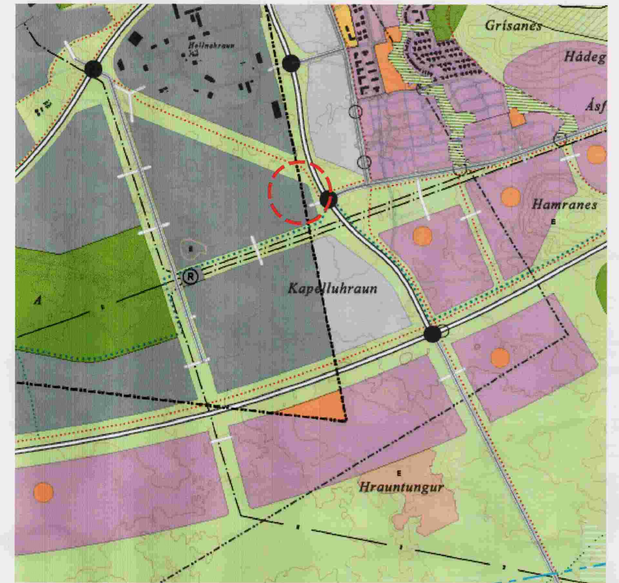
Úr aðalskipulagi Hafnarfjarðar 2005 - 2025.

Deiliskipulag þetta sem fengið hefur málsmeðferð skv. 2. mgr. 26. gr. skipulags- og byggingarlaga nr. 73/1997 var samþykkt á afgreiðslufundi skipulags- og byggingarfulltrúa þann: