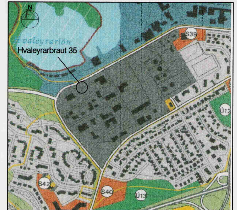
Deiliskipulag fyrir breytingu

Deiliskipulagid var samþykkt 30.06.1998. og óðladist gildi 20. nóvember 1998