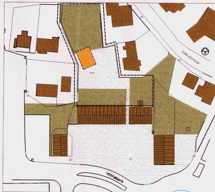
Tillaga að breytingu á deiliskipulagi miðbæjar Hafnarfjarðar. Breytingin felst í að útbúa byggingarreit fyrir húsið sem stóð við Strandgötu 5, Beggubúð, og safnagarð í tengslum við byggðasafnið með möguleikum til leikja.