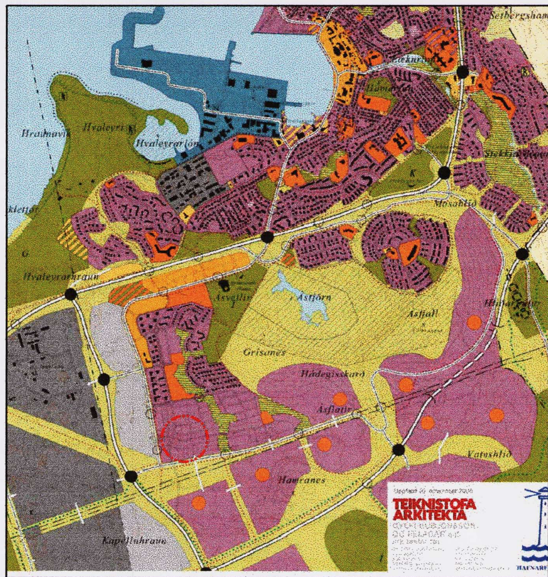
Hluti af aðalskipulagi Hafnarfjarðar. (2005-2017).