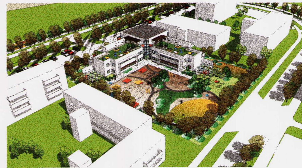
SKÝRINGAMYNDIR (möguleg útfærsla)