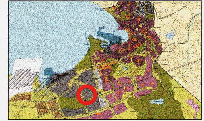
ADALSKIPULAG HAFNARFJARÐAR 2005-2025, HLUTI