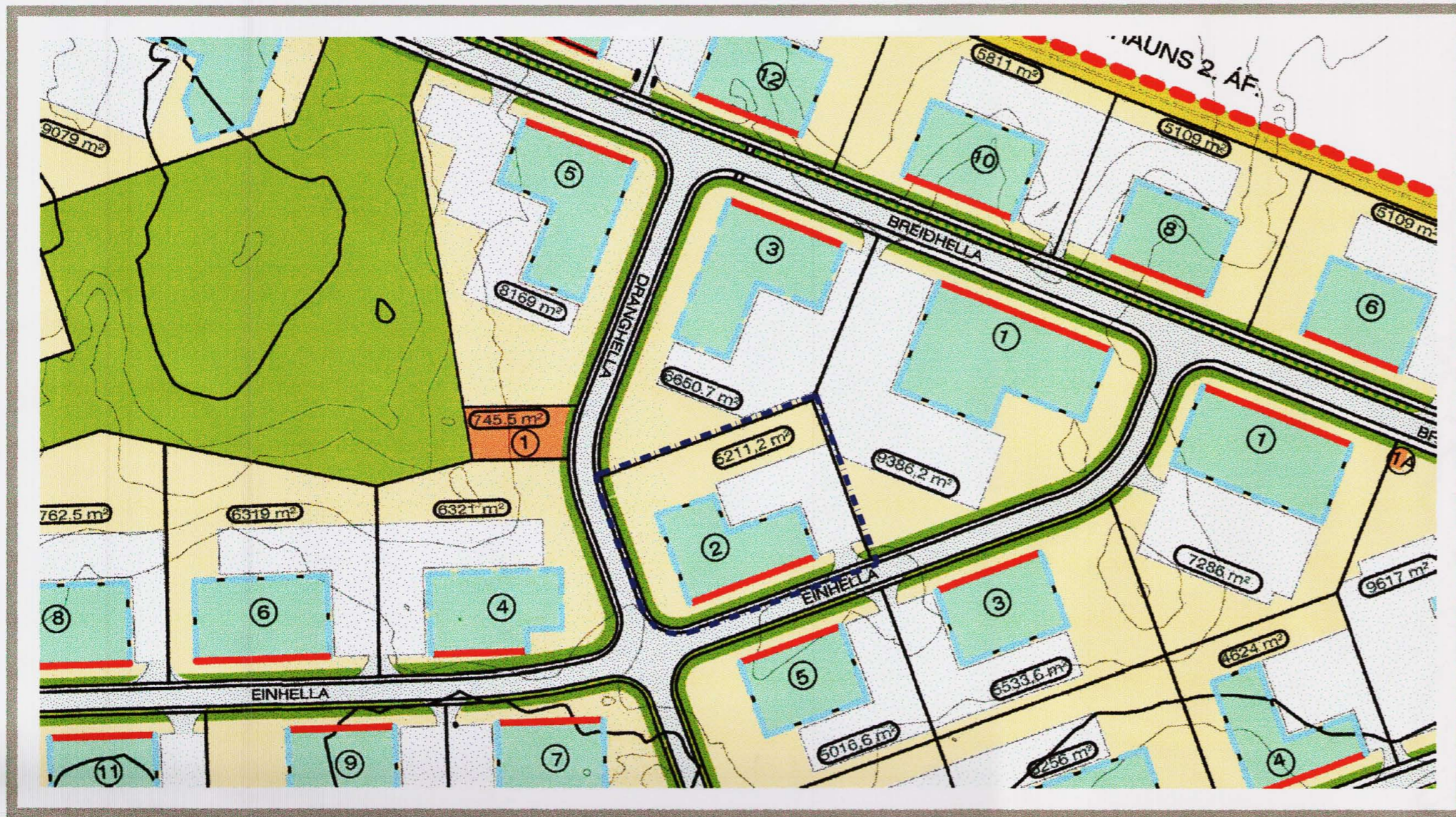
Hluti af gildandi deiliskipulagi samþykkt í Bæjarstjórn Hafnarfjarðar 15.mai 2007 Mkv. 1:2000