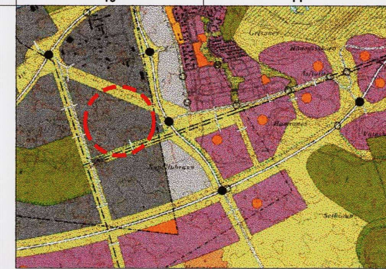
Hluti af aðalskipulagi Hafnarfjarðar 2005-2025