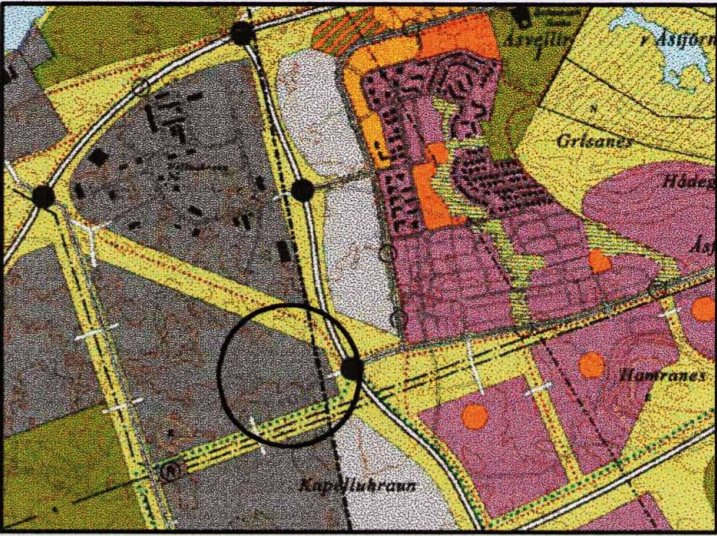
HILUTI AF AÐALSKIPULAGI HAFNARFJARÐAR MÆLIKVARÐI 1:20.000