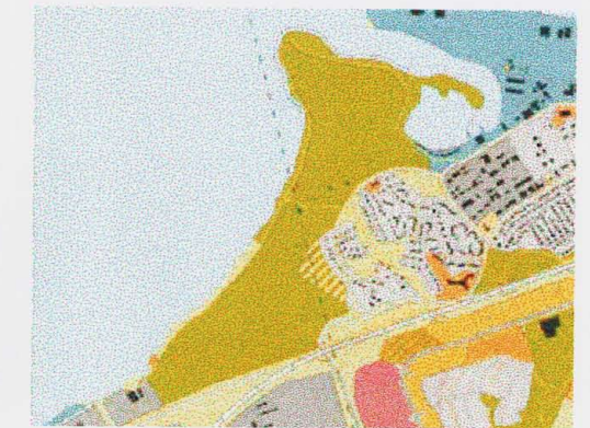
ADALSKIPULAG HAFNARFJARÐAR 1995-2015