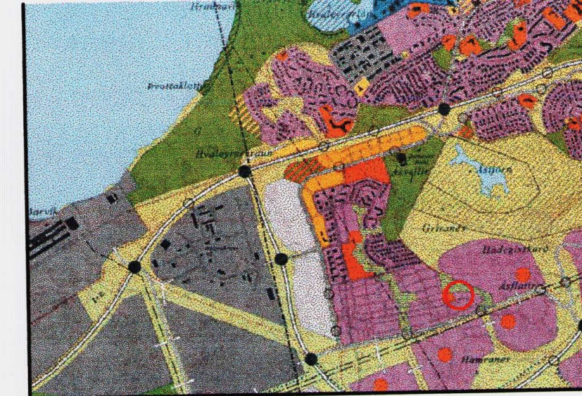
Aðalskipulag Hafnarfjarðar 2005-2025