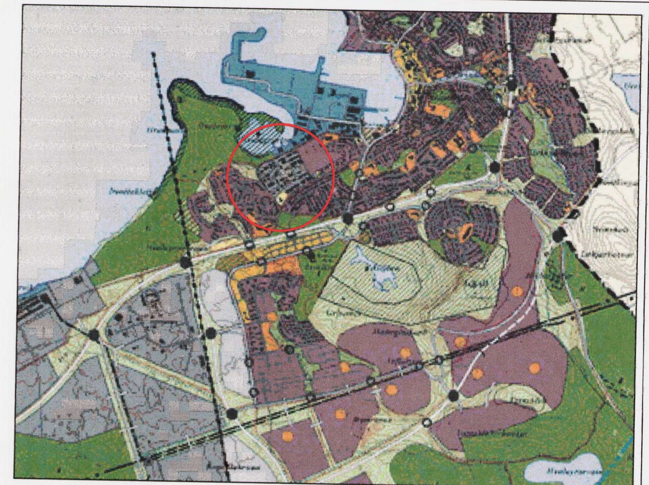
Hluti af aðalskipulagi Hafnarfjarðar.

Uppdrátturinn var auglýstur frá 20.9.2007 til 18.10.2007.