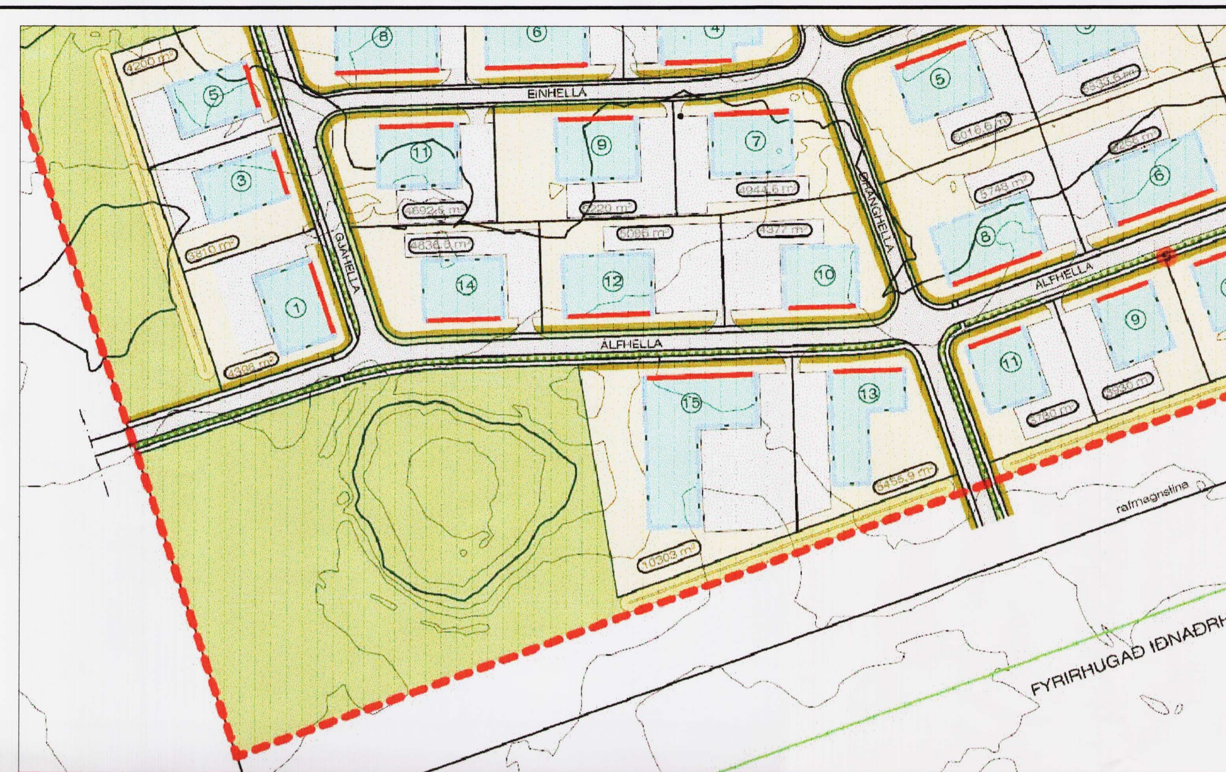
Hellnabraun 2. áfangi, deiliskipulag 12. júní 2007 mkv. 1:2000