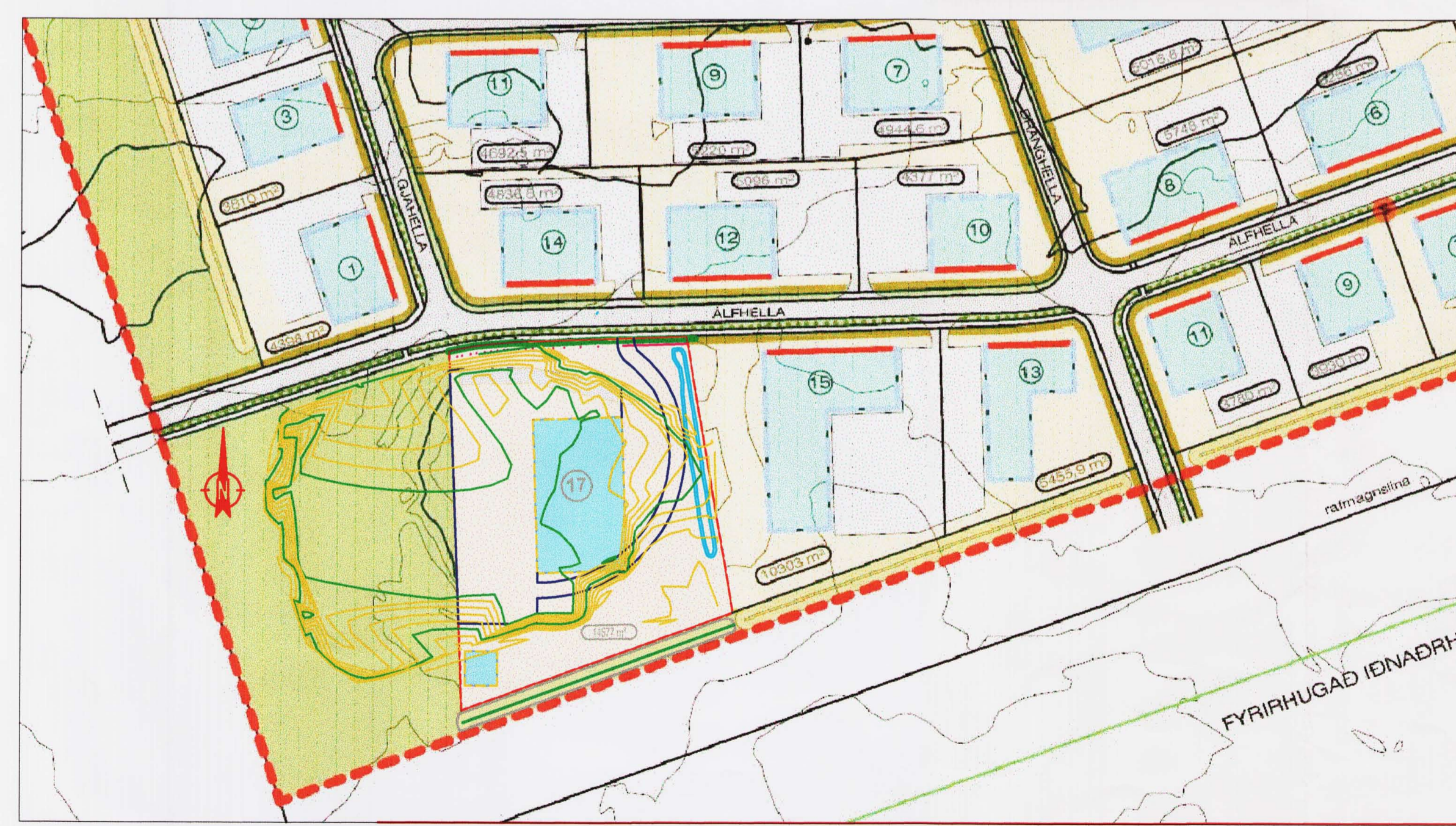
Tillaga að breyttu deiliskipulagi fyrir Álfhelli 17. mkv. 1:2000

Hafnarfjarðarbær Skipulag- og byggingarsvið