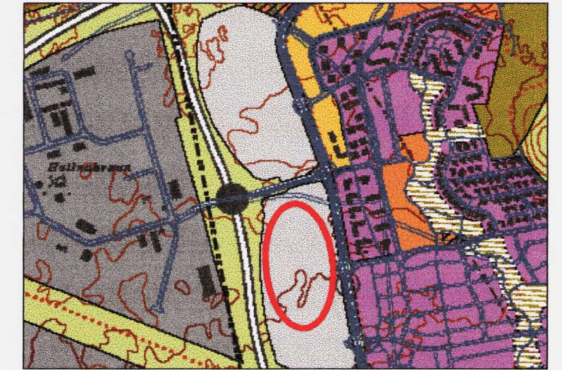
ADALSKIPULAG HAFNARFJRADAR 2005-2025

DEILISKIPULAGS BREYTING ÞESSI VAR SAMÞYKKT Í SKIPULAGS- OG BYGGINGARRÁÐI HAFNARFJARÐAR