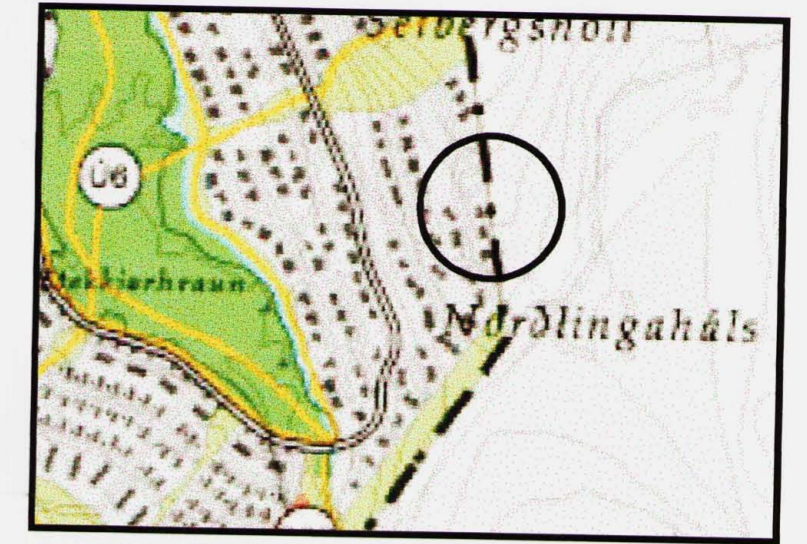
Staðsetning í bjarlandi

--- MÖRK DEILISKIPULAGSSVÆÐIS - - - LÓÐARMÖRK