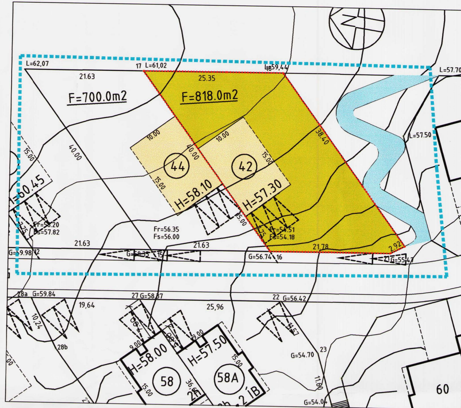
ný lóðarmörk að Lindarbergi 42 Flatarmál lóðar: 818m²