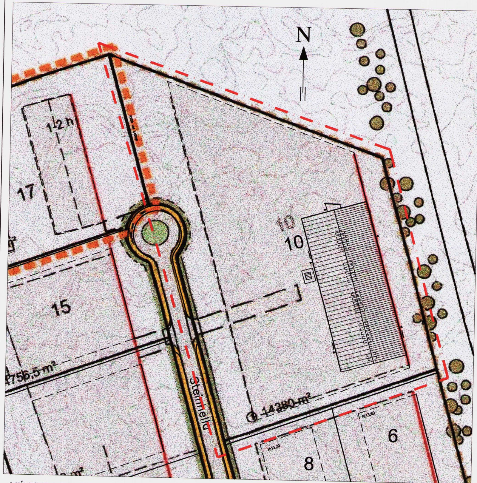
NÚGILDANDI DEILISKÍPULAGSUPPRÁTTUR 1:1000

"Lóðir þessar standa á áberandi stað gagnvart fyrirhuguðum nýjum gatnamótum Reykjanesbrautar og Krísvíkurvegar og verða andspænis nýjum lóðum Krísvíkurvegar og Ásbrautar. Í samræmi við markmiðssetningu þessa deiliskípulags um bætt ásynd kverfisins gagnvart Reykjanesbraut, þarf að gera sérstakar kröfur um ásynd húss og frágang lóðar. Því verður ekki fallist á byggingarleyfissókn, sem að mati byggingarnefndar uppfyllir ekki slíkar kröfur. Að öðru leyti gilda skilmálar skv. 2. kafla.