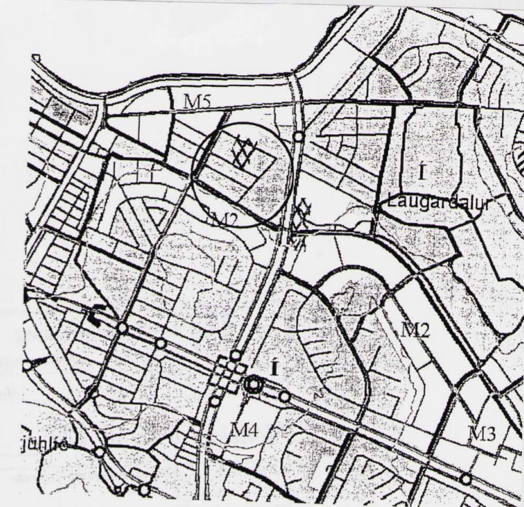
ADALSKIPULAG REYKJAVÍKUR 2001-2024