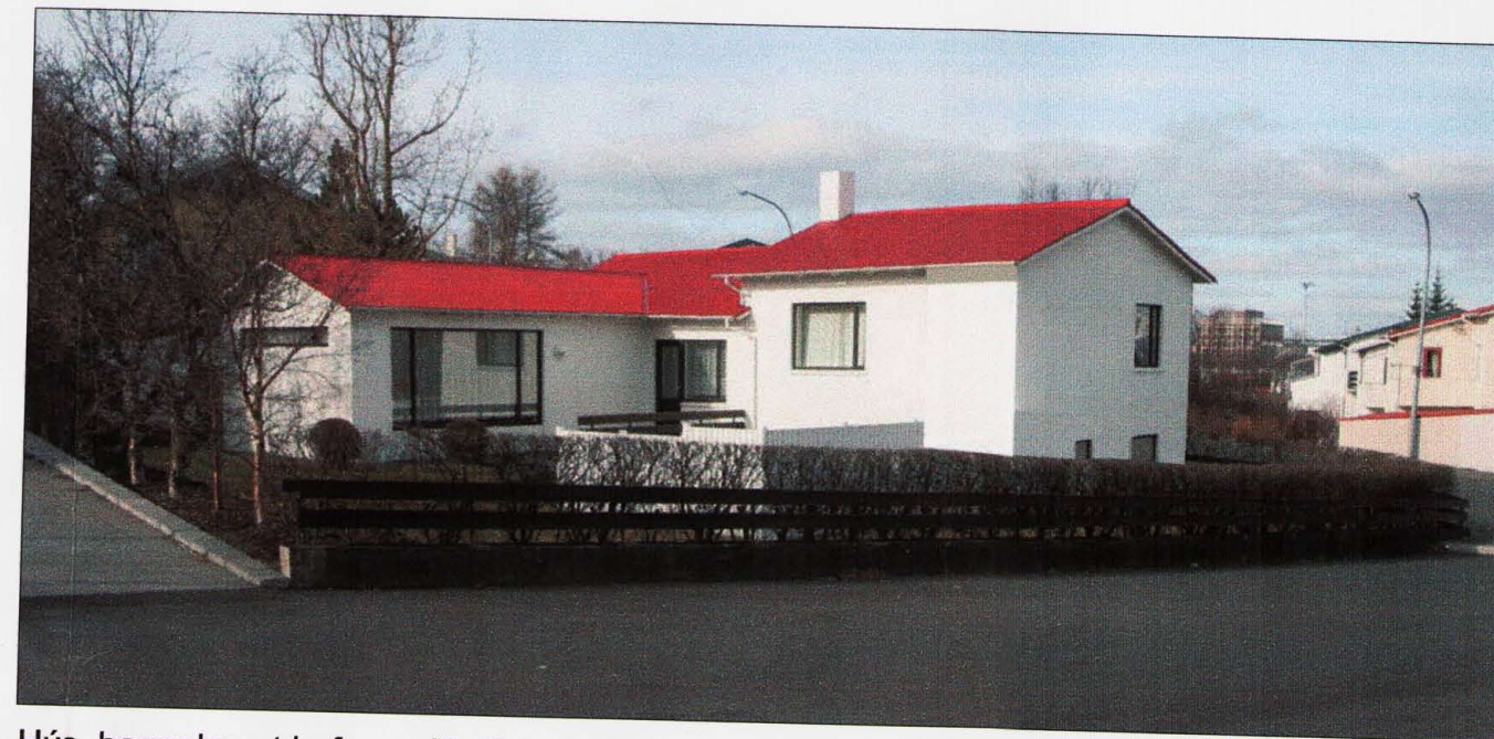
Hús, þegar byggt hefur verið við það skv. breyttu deilisskipulagi.