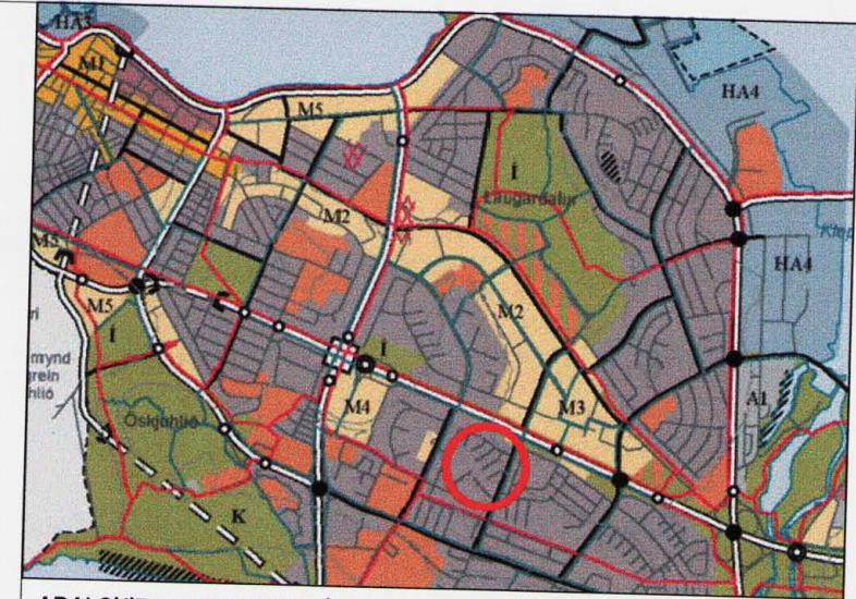
ADALSKIPULAG REYKJAVÍKUR 2001-2024, ÚRDRÁTTUR