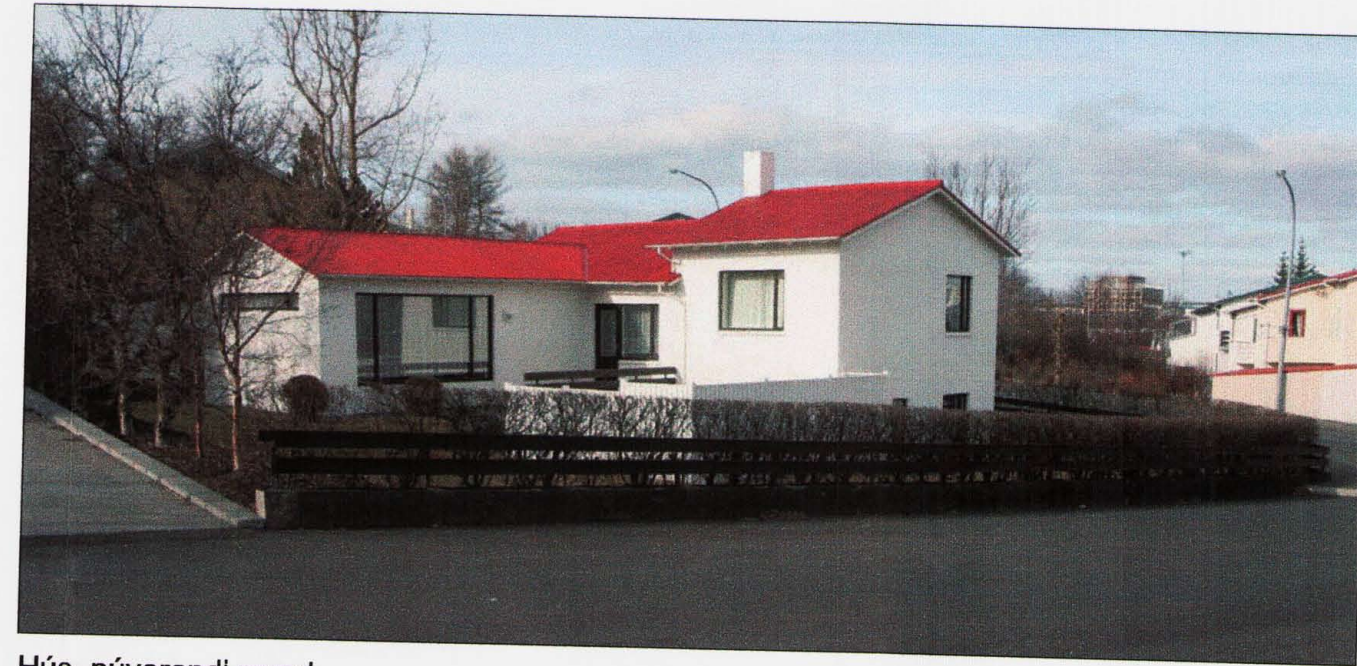
Hús, núverandi mynd.

Tillaga að breytingu á hluta af gildandi deilisskipulagi fyrir Heiðargerðisreit, varðar Heiðargerðir 84