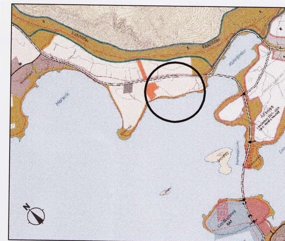
Hluti af Aðalskipulagi Reykjavíkur 2001-2024