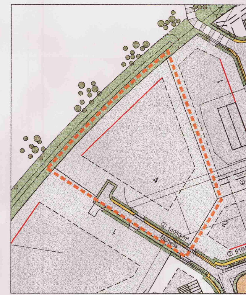
DEILISKIPULAG FYRIR BREYTINGU