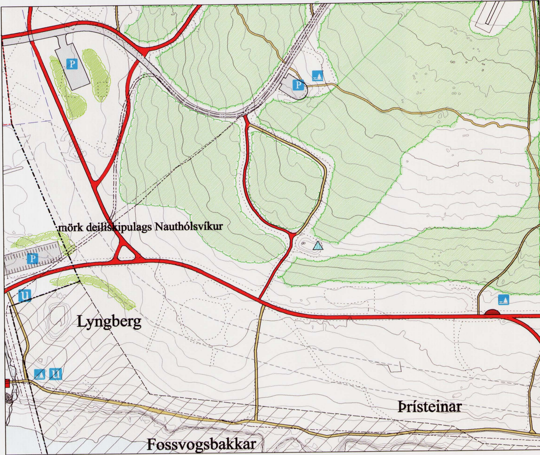
Gildandi deiliskipulag frá 1998, m.s.br. mkv. 1:2000