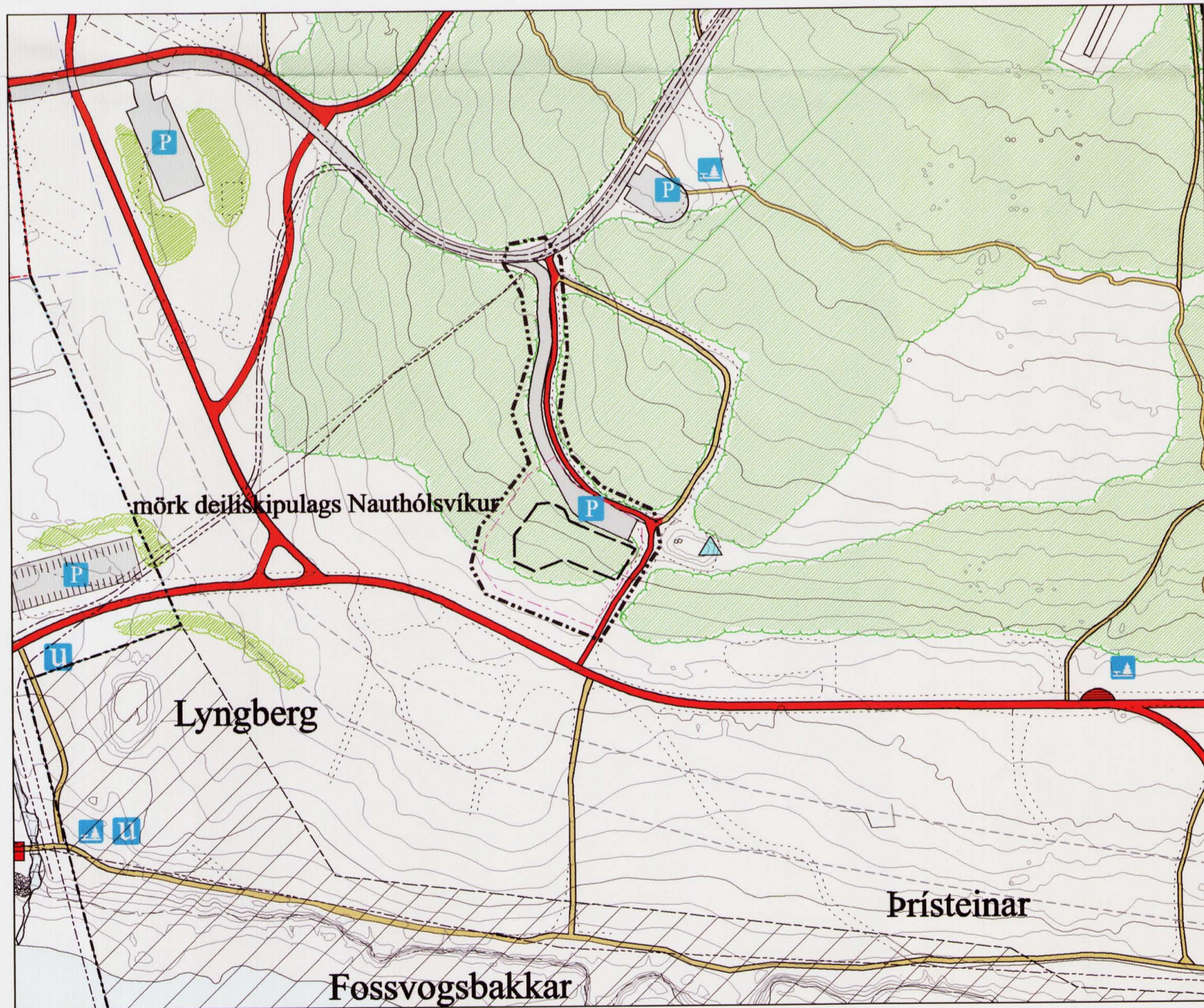
Tillaga að breytingu á deiliskipulagi í nóvember 2007, mkv. 1:2000