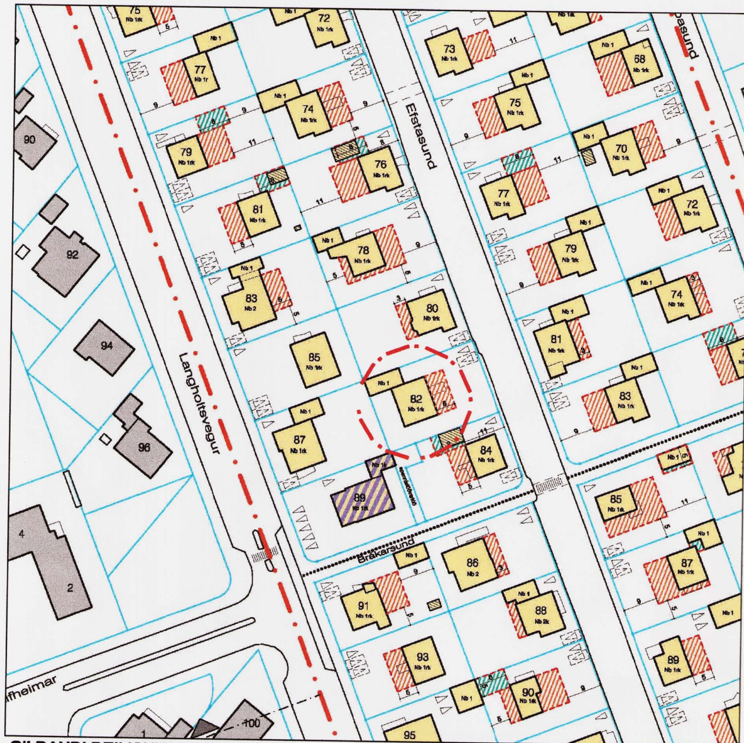
GILDANDI DEILISKIPULAG, samþ. í borgarráði þann 10.nóv. 2005