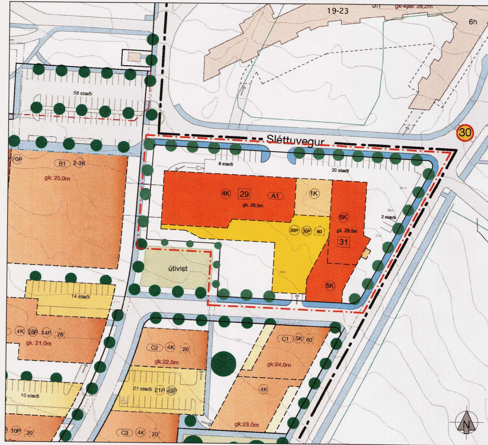
Tillaga að breyttu deiliskipulagi 1:1000