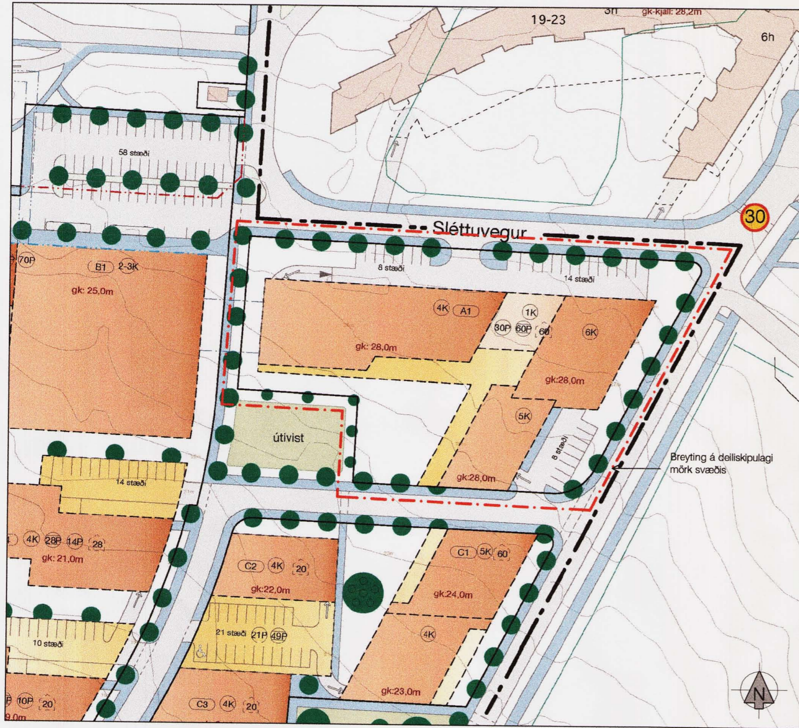
Hluti gildandi deiliskipulags Sléttuvegar - samþykkt í borgarráði 12.júlí 2007