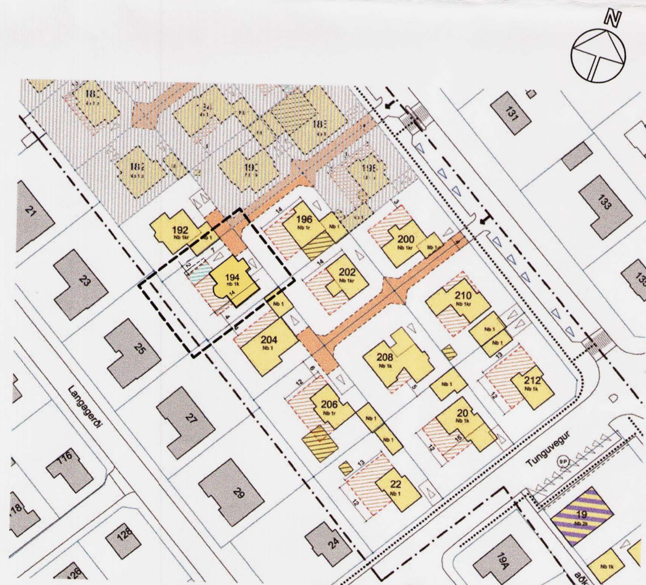
Tillaga að breyttu deiliskipulagi vegna lóðar við Sogaveg 194. Mkv: 1:1000