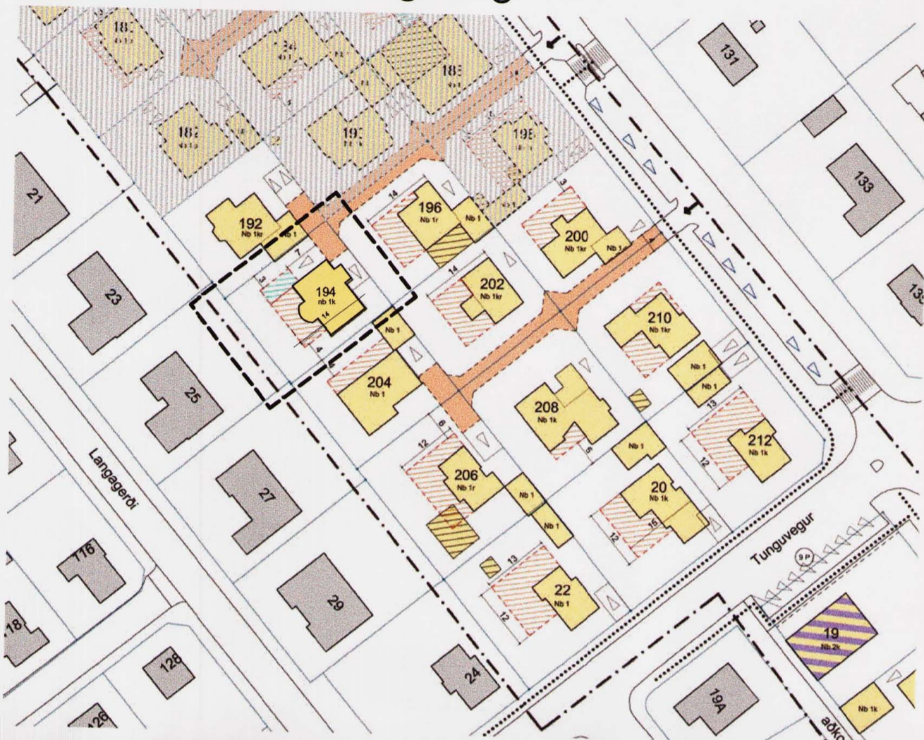
Hluti deiliskipulags fyrir Sogaveg, samþykkt í borgarráði 7. október 2004. Mkv: 1:1000