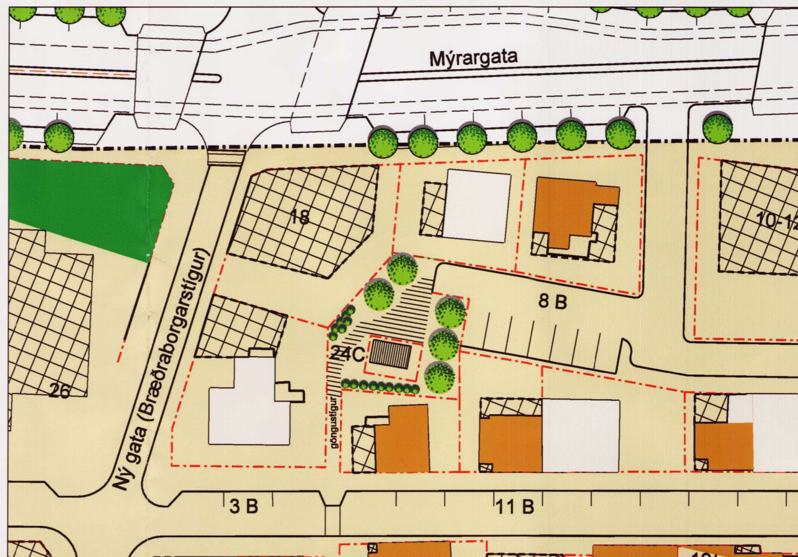
SKÝRINGARMYND MKV. 1:500