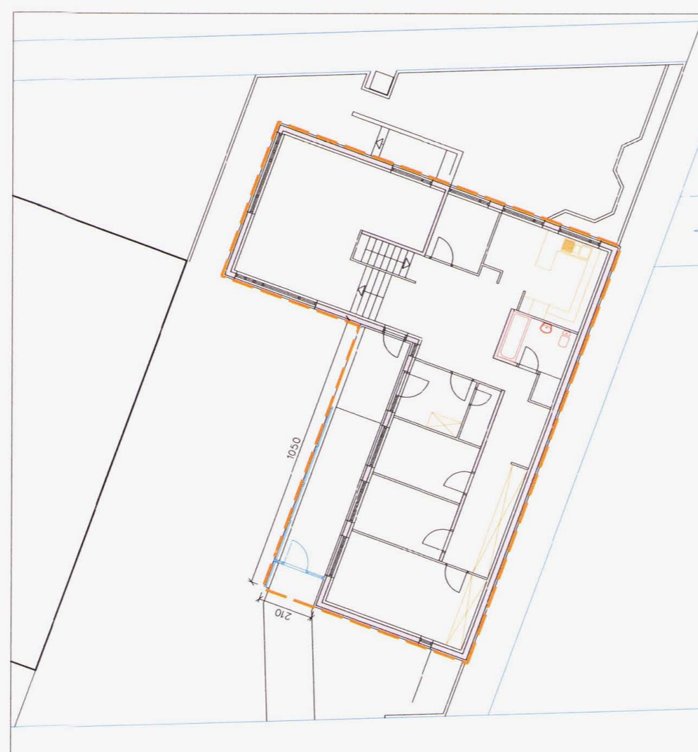
4 Grunnmynd - skýringarmynd, 1:200