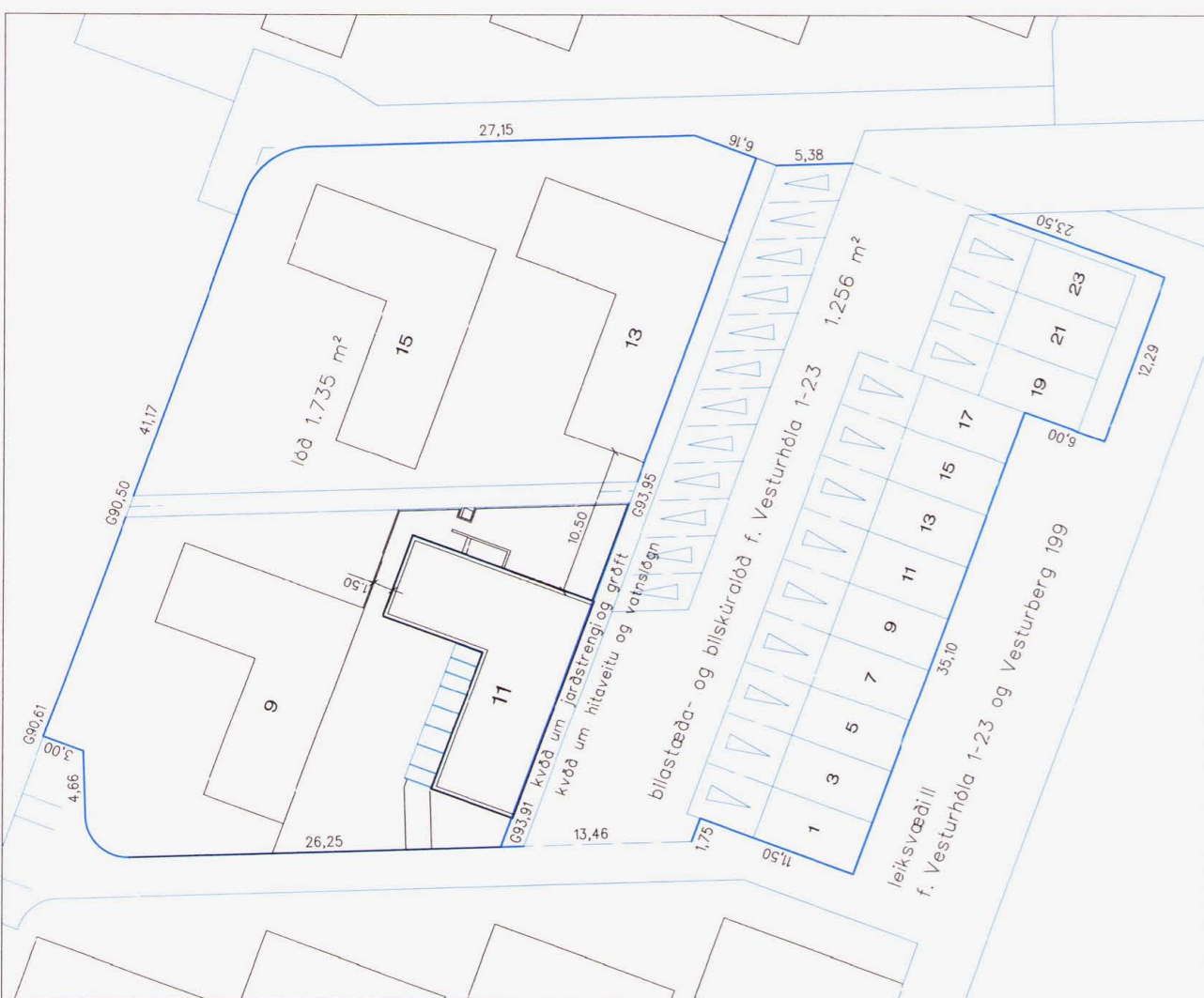
3 Afstöðumynd - skýringarmynd, 1:500