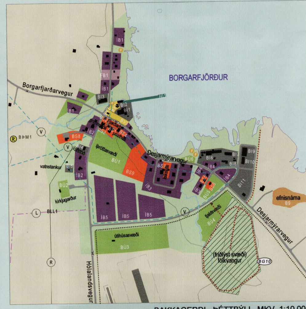
BAKKAGERÐI - PÉTTYLI MKV. 1:10.000