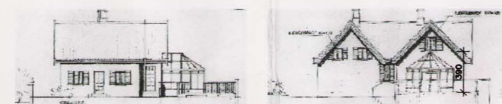
Skýringarmyndir, norðausturhlíð og norðvesturhlíð Mkv. 1:500

Að öðru leyti gilda eldri skilmálar, dags samp. 15.09.2005