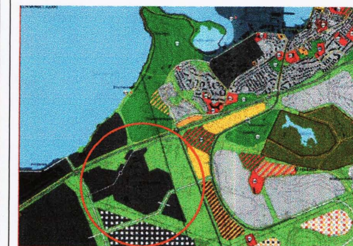
ADALSKIPULAG HAFNARFJARÐAR 1995-2015